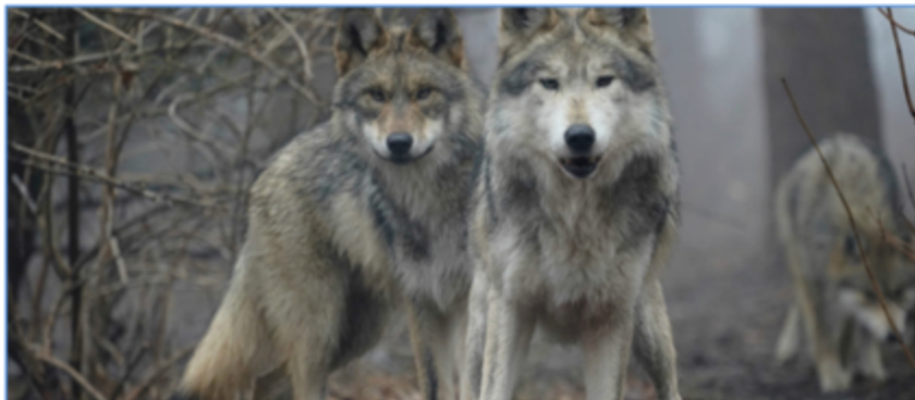
Figura 4. Lobo gris mexicano