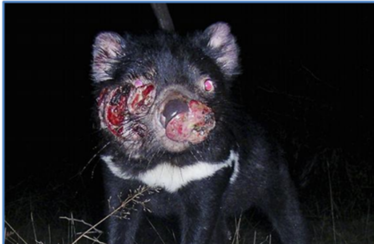
Figura 5. Demonio de Tasmania con tumor facial