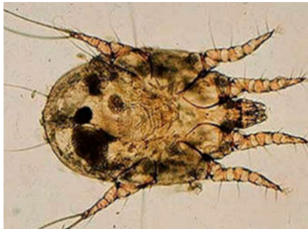
Figura 2. Otodectes cynotis