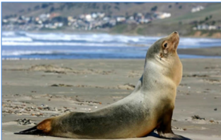
Figura 3. Lobo marino de California

En lugares como California se ha observado que la contaminación del agua por una familia de pesticidas ambientales, llamados organoclorados, así como de hidrocarburos aromáticos policíclicos, que son contaminantes que provienen de desechos del petróleo, gasolina y basura que se deposita en las aguas de la región, ocasionan que leones marinos de California puedan padecer cáncer en la vagina, cérvix y vejiga en el caso de las hembras, y cáncer de pene, prepucio y uretra en los machos (Browning et al. , 2015).